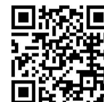
Läs mer om underhåll genom att skanna koden eller gå in på www.westal.se