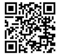
Läs mer om underhåll genom att skanna koden eller gå in på www.westal.se