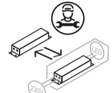
Utbytbart drivdon av en fackman.

Ytterhölje kabel \varnothing : 5-12 mm Ledararea: 0,5-2,5mm 2 Skalllängd ledare: 5-15mm