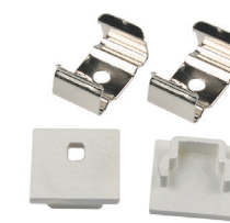
Clips och gavlar

75 066 87 Clips: 75 078 24 Gavel utan hålt: 75 067 01 Gavel med hålt: 75 067 10 Rek. maxavstånd clips: 500mm