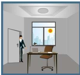
Då det är tillräckligt mycket dagsljus i rummet tänds inte armaturen.