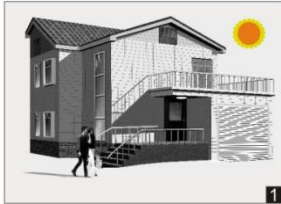
Under dagens ljusa timmar tänds inte armaturen.

I armaturen finns styrning som medför funktioner som tänd och släck, automatisk ljussänkning, närvarostyrning och tändning beroende på dagsljuset. Nedan följer exempel på hur funktionerna kan användas.