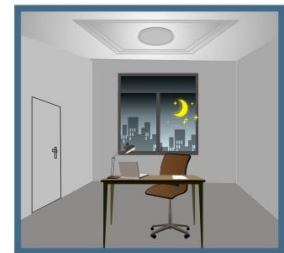
Efter en bestämd tid släcks armaturen om ingen rörelse uppfattas.

Inställningar - Genom att ställa in olika kombinationer på DIP switchen kan du få funktioner som passar just ditt behov.