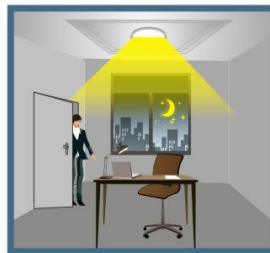
Då det inte är tillräckligt mycket dagsljus i rummet tänds armaturen när det är rörelse i rummet.