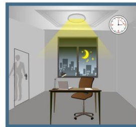
Efter en viss tid utan rörelse i rummet sänks ljusflödet från armaturen.