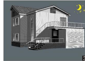
Efter en bestämd tid släcks armaturen om ingen rörelse uppfattas.