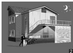
Rörelsedetektor tänder armaturen när det är mörkt ute.