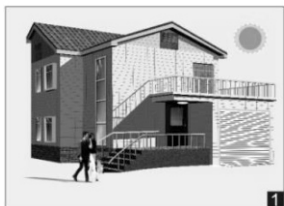
Under dagens ljusa timmar tänds inte armaturen.

I armaturen finns styrning som medför funktionerna tänd och släck, automatisk ljussänkning, närvarostyrning och tändning beroende på dagsljuset. Nedan följer exempel på hur funktionerna kan användas.