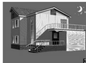
Efter en bestämd tid släcks armaturen om ingen rörelse uppfattas.

Inställningar Genom att ställa in olika kombinationer på DIP switchen kan du få funktioner som passar just ditt behov.